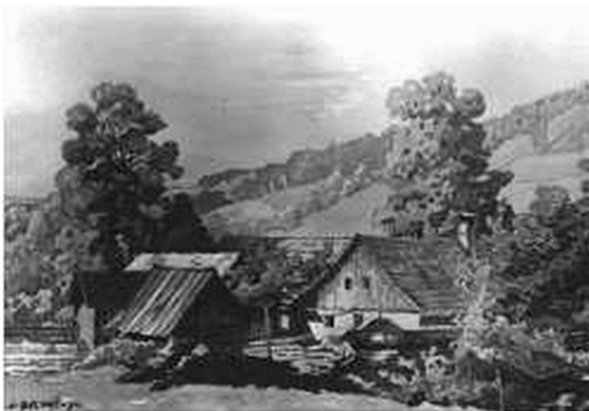
Mlýn okolo roku 1935