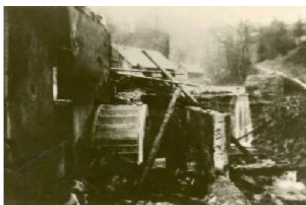
Mlýnské kolo, kde se zachránili dva partyzáni