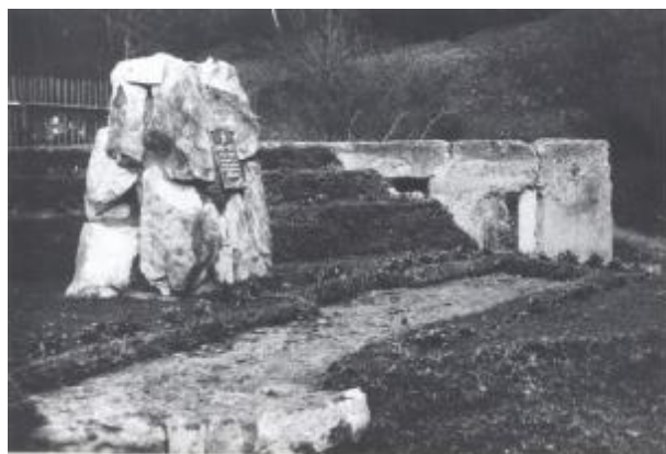
Památník z roku 1961

V troskách vypáleného mlýna byl později zbudován památník, který návštěvníci mohou najít při procházení naučné stezky se stejným názvem, NS Juříčkův mlýn.