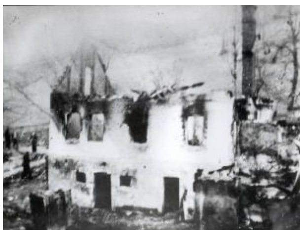
Mlýn po vypálení