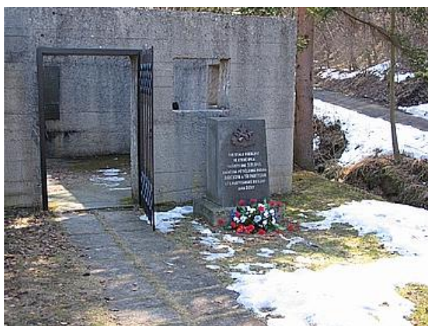
Památník přemístěný roku 2000