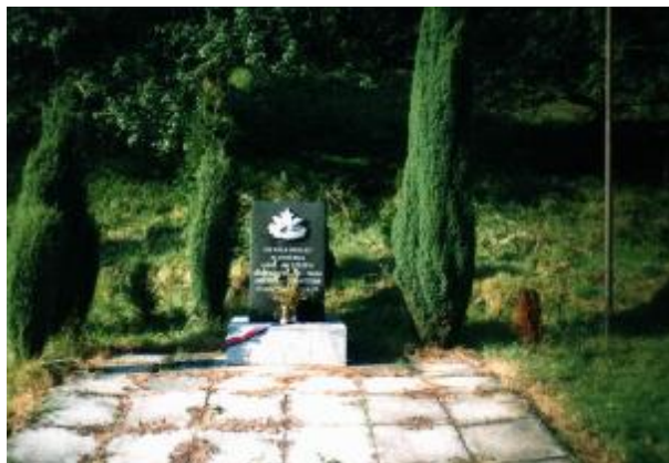
Památník z roku 1975